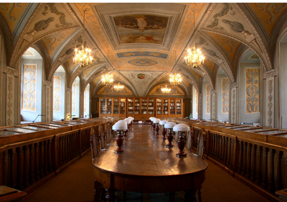
👉 Sala Franciszka Smuglewicza w Bibliotece Uniwersytetu Wileńskiego (domena publiczna)