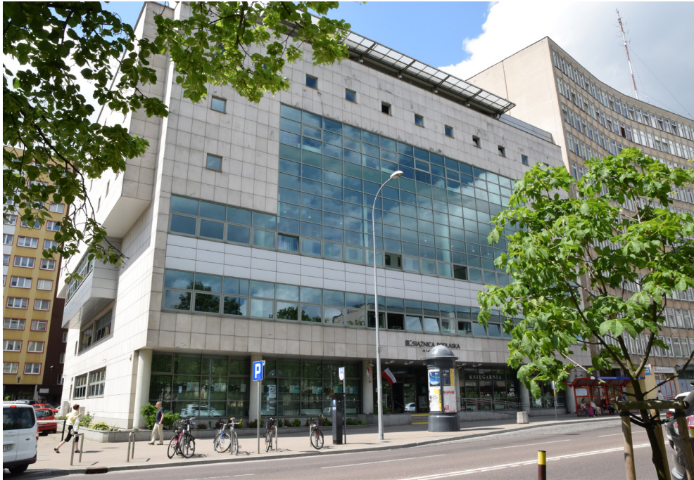
👉 Budynek Książnicy Podlaskiej (Bogumiła Maleszewska-Oksztol)