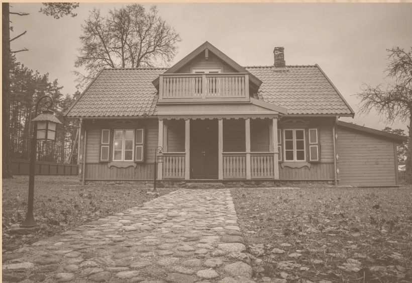
👉 Dom Józefa Mackiewicza (Fundacja Wileńszczyzna)