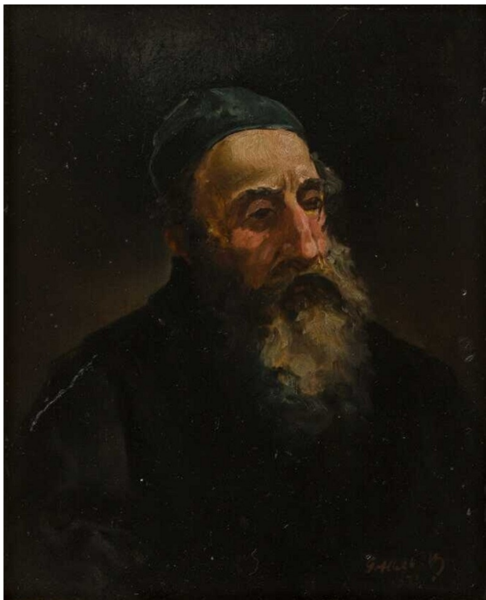
Maurycy Gottlieb, Studium Żyda w jarmulce , 1873