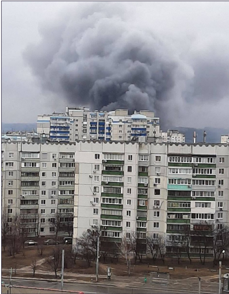
Ukraina, 3 marca 2022 r.