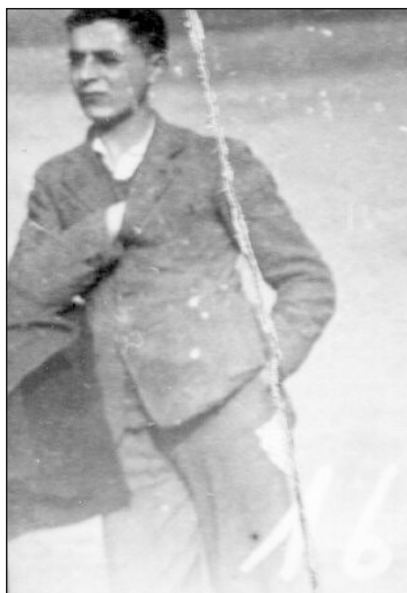
Mordechaj Tenenbaum (1916, Warszawa – 20 VIII 1943, Białystok)

„Gawęda i spacer po nieistniejącym już dziś żydowskim Białymstoku, który do 1939 roku kipiał wielokulturowym życiem i sąsiedztwem wielu kultur i religii. Pokażę miejsca nieoczywiste i opowiem o związanych z nimi ludziach, bo to oni byli i są najważniejsi. Spacer zakończymy w MIEJSCU – czyli w najmniejszym muzeum żydowskim na świecie, które powstało dosłownie przed... 3 tygodniami”.